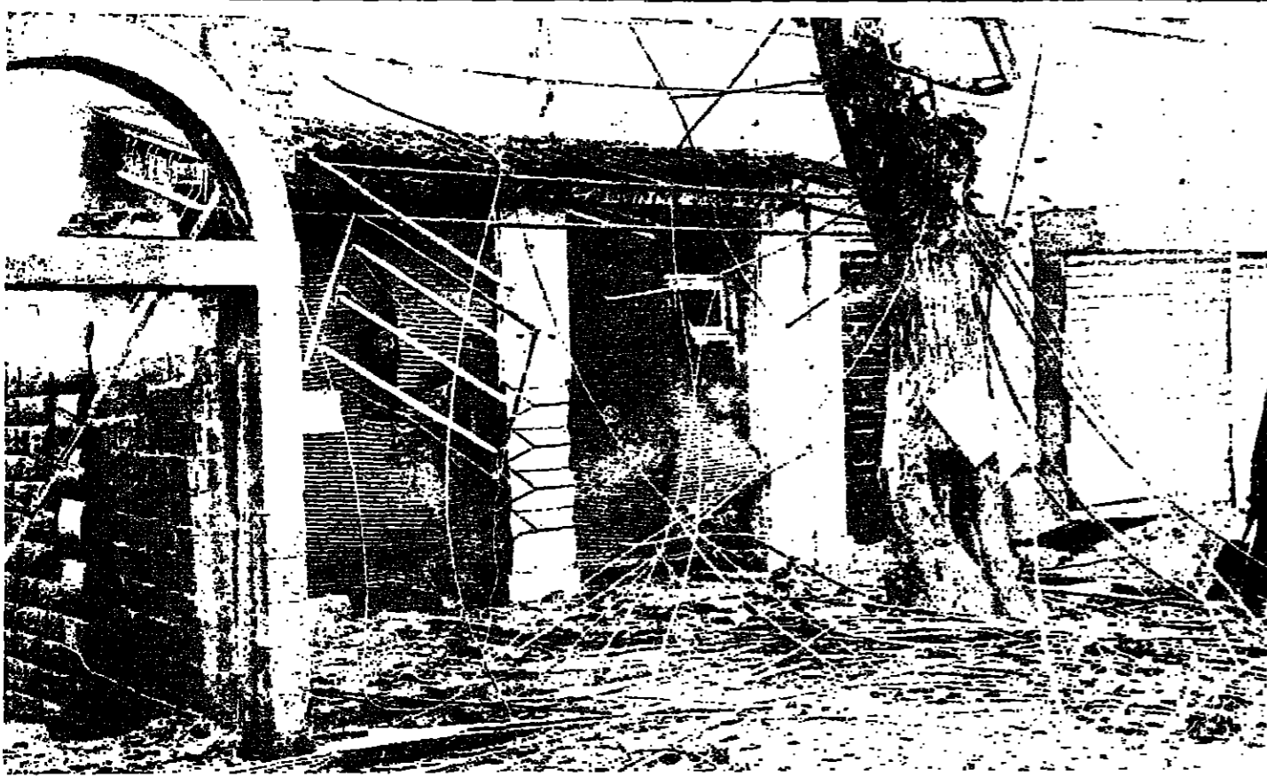
محل هيكل أبو عبيد وقد تحطمت أبوابه